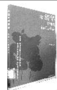
《在清华听讲座》 清华大学出版社

当代社会，科学技术飞速发展，作为一名新时代的大学生，需要全面的素质来应对社会的挑战。本书收录了一些著名学者、两院院士以及各领域的学术带头人在信息科学、生物科技、激光、核能工程等方面的内容提供了最新研究的成果。本书将会带你走进清华的课堂，与清华学子一起去聆听大师们内容丰富、妙趣横生的演讲。