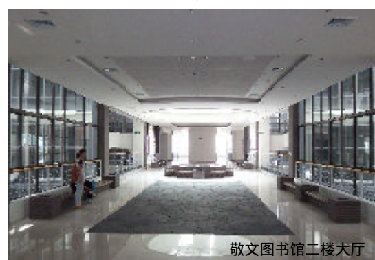
敬文圖書館二樓大廳

完成。這次的搬遷工作，有將近2000名同學利用休息時間義務參與，充分體現了當代大學生高尚的奉獻精神。經過緊張籌備，4月24日，敬文圖書館報刊閱覽室率先開放。其他閱覽室的圖書搬遷工作也都基本完成，正在進行圖書上架工作，很快就能向讀者全面開放。