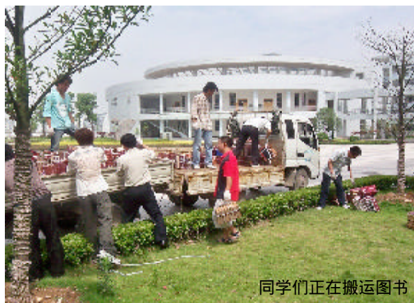
同学们正在搬运图书