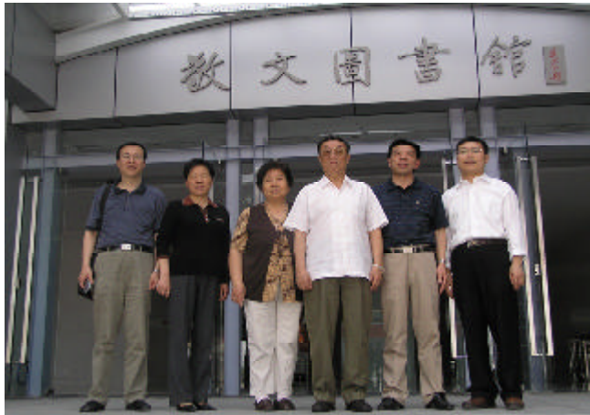
圖為王蒙先生和余淑珍副校長及有關部門領導合影

5月14日下午，中國當代著名作家、原中國作協第一副主席、文化部部长、現全國政協常委、安徽師範大學中國詩學研究中心榮譽顧問王蒙先生，在副校長余淑珍、文學院副院長胡傳志、詩學研究中心主任丁放及圖書館館長莊華峰等人的陪同下，興致勃勃地參觀考察了新落成的敬文圖書館。