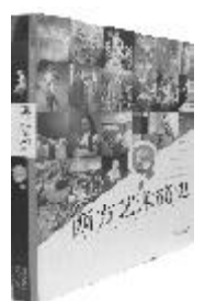
《西方艺术简史》 四川文艺出版社

这是一本简明扼要、图文并茂的人文素质教育读本，适宜于对西方艺术感兴趣的大学学生阅读，也适宜于那些需要提升自己文化素质的青年人阅读。西方艺术史往往让人觉得驳杂繁芜、高深莫测，而本书用通俗的笔触，以身临其境的感受带领读者深入艺术史现场，感悟艺术之趣、历史之真、知性之美，给人耳目一新之感。