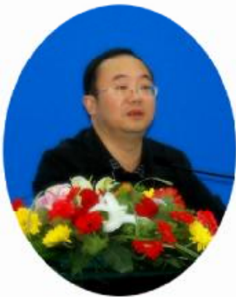
冯刚教授做客敬文讲坛

2010年，敬文讲坛共举办了16讲，先后邀请教育部高校社会发展研究中心主任冯刚教授、华东师范大学哲学系潘德荣教授、中华职业教育社国学导师王少农先生，以及我校王自东副教授、俞晓红教授、桑青松教授、朱平教