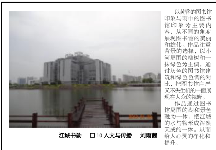
江城书韵 □ 10 人文与传播 刘雨茜

《午后的图书馆》通过图书馆里桌子上的标示牌及上面的字, 提醒进入图书馆的每个人都应当珍惜馆藏书刊, 应该把它当成心灵家园一样去呵护, 表现了我校图书馆安静舒适的环境。作品主要运用了以下摄影技巧: 第一, 画面表现真实、自然。午后的阳光从窗户斜射入馆内, 温暖而真实自然。第二, 画面构图。这幅作品是用40mm镜头, 跟桌子在同一水平面的角度, f4.5的光圈拍摄的。焦点对准桌子上的标示牌, 其余的如书架、桌子的前面部分都被虚化, 利用虚实对比突出画面的主体——标示牌。第三, 光线和色彩的处理。采用顺光拍摄, 在午后较柔和的阳光下, 勾勒出不同层次的影响。虽然这只是图书馆中很不起眼的角落, 但却体现了图书馆环境的安静舒适, 加上摄影技巧的应用, 使得这幅作品看起来具有一种安静美, 这就是我“印象”中的图书馆。