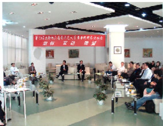
与会代表在敬文图书馆书吧座谈