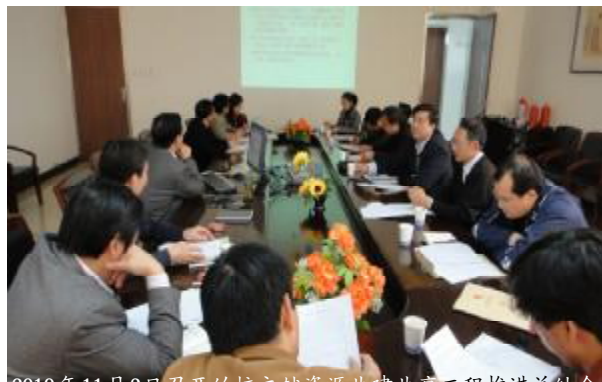
2010年11月3日召开的校文献资源共建共享工程推进总结会

协调组、业务指导组和技术保障组，负责整个共享工程的协调、指导和保障工作。紧接着，图书馆对学院资料室管理人员进行了业务培训，介绍了图书分类及编目的基本知识、ILAS管理系统的基本使用方法，并协助各学院购置磁条等相关设备，上门安装调试软件。此外，图书馆还起草了《安徽师范大学图书馆与学院资料室文献信息资源共建共享工程建设方案》，提出了建设目标和建设步骤。第二阶段：资源建设。为进一步提高认识，统一思想，2009年9月24日，王绍武副校长主持召开了学校文献信息资源共建共享工程建设协调会，要求整个共享工程于2010年6月底以前基本完成，2010年下半年进一步完善、提