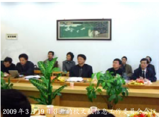
2009年3月19日召开的校文献信息工作委员会会议

持召开了校文献信息工作委员会会议，要求图书馆与学院资料室加强协作，尽快实现校内文献信息资源的共建与共享，并提出了时间表，要求在两年内基本完成全校文献信息资源的共建工作。会后，各学院积极组织人员，准备设备，清理图书，为共享工程做好前期准备工作。图书馆成立了由馆长任组长的领导小组，下设联络